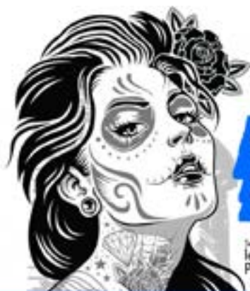
Ilustración y narrativa