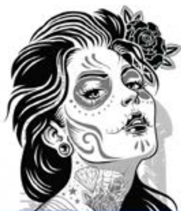
Ilustración y narrativa