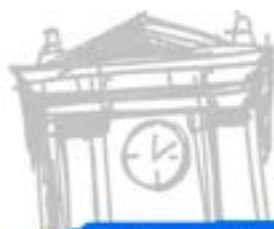
Ilustración y narrativa